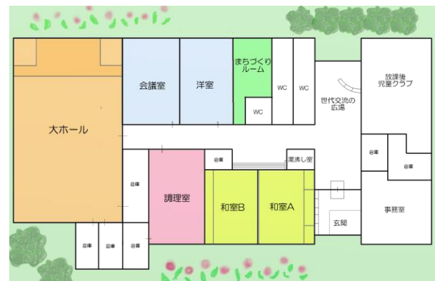
あじさい交流館平面図

当日の会場図とタイムテーブルをご覧ください。 あじさい交流館のスリッパをお使いの場合「上履き」は不要です。「マスク」は忘れずご準備ください。