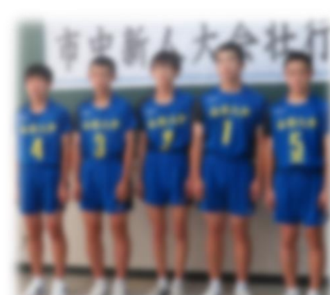
市中新人大会壮行式より