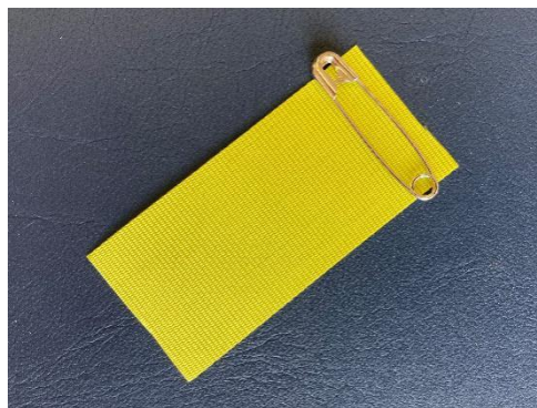
「リボンメッセージ運動」の黄色リボン

この共生の心が響き合い、一人ひとりの存在を大切にする学校、そして社会を創り上げる八中生であることを心から願っています。