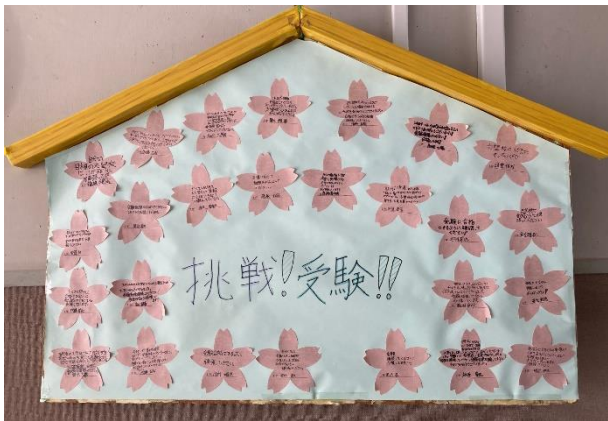
1年生より「合格祈願の絵馬」

先週末から私立高校の入学選抜試験が始まり、3年生は3月まで続く大切な2ヶ月間を迎えています。大きな試練ではありますが、自分で積み重ねてきた時間と、蓄えた力を信じて試験当日を迎えてほしいものです。3年生一人一人が万全の体制で試験に挑むことが出来るように、全校生徒で健康管理と落ち着いた雰囲気づくりに努めて参ります。各御家庭での御支援をよろしくお願い致します。