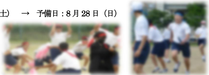
(令和3年度 スクラム8より)

* 当日参観のご案内は、今年度も保護者の方のみとなる見通しです。状況により変更のある場合改めてお知らせ致します。何卒ご容赦ください。