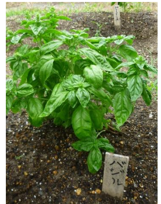
あじさい農園の夏野菜(7月12日撮影)